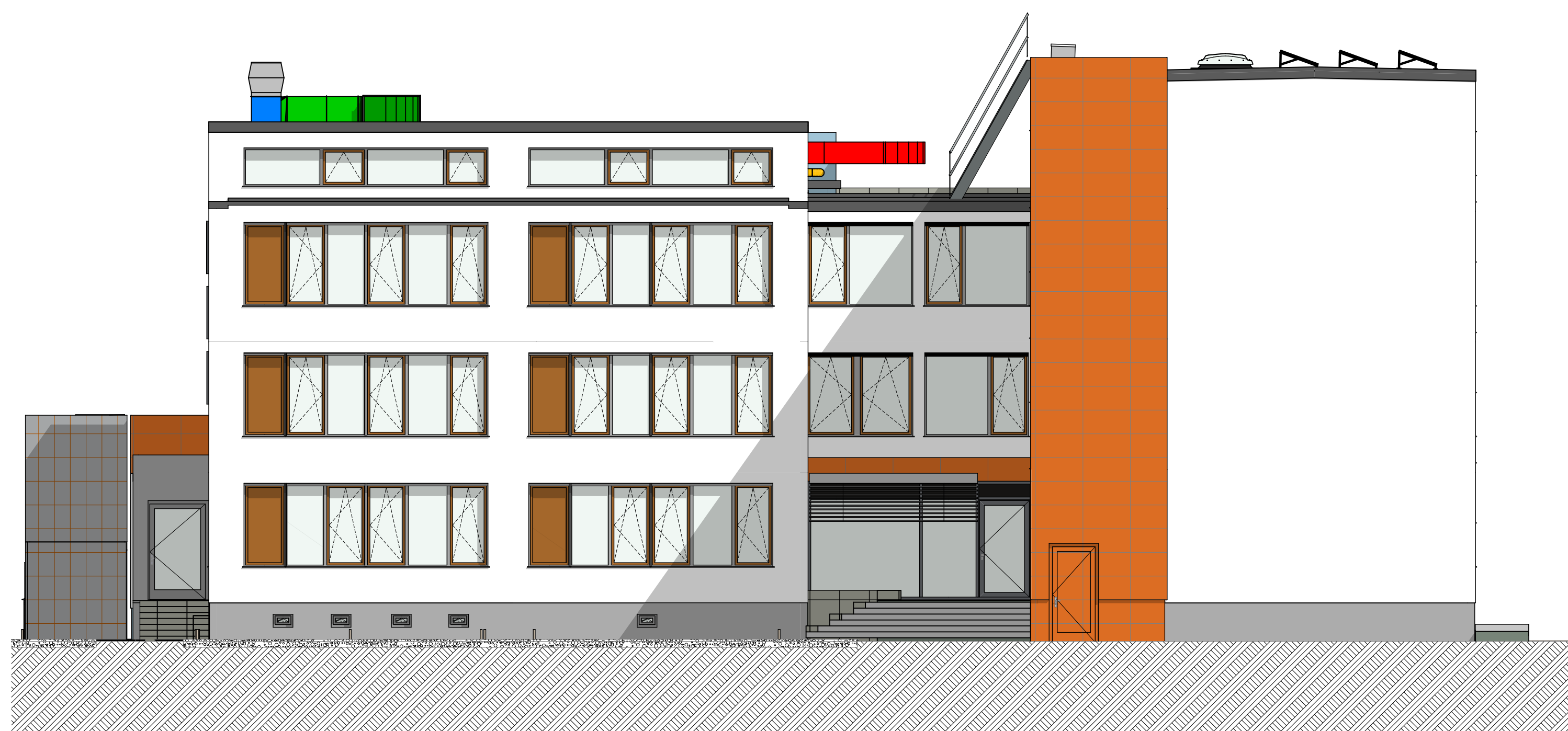
Ansicht von Westen