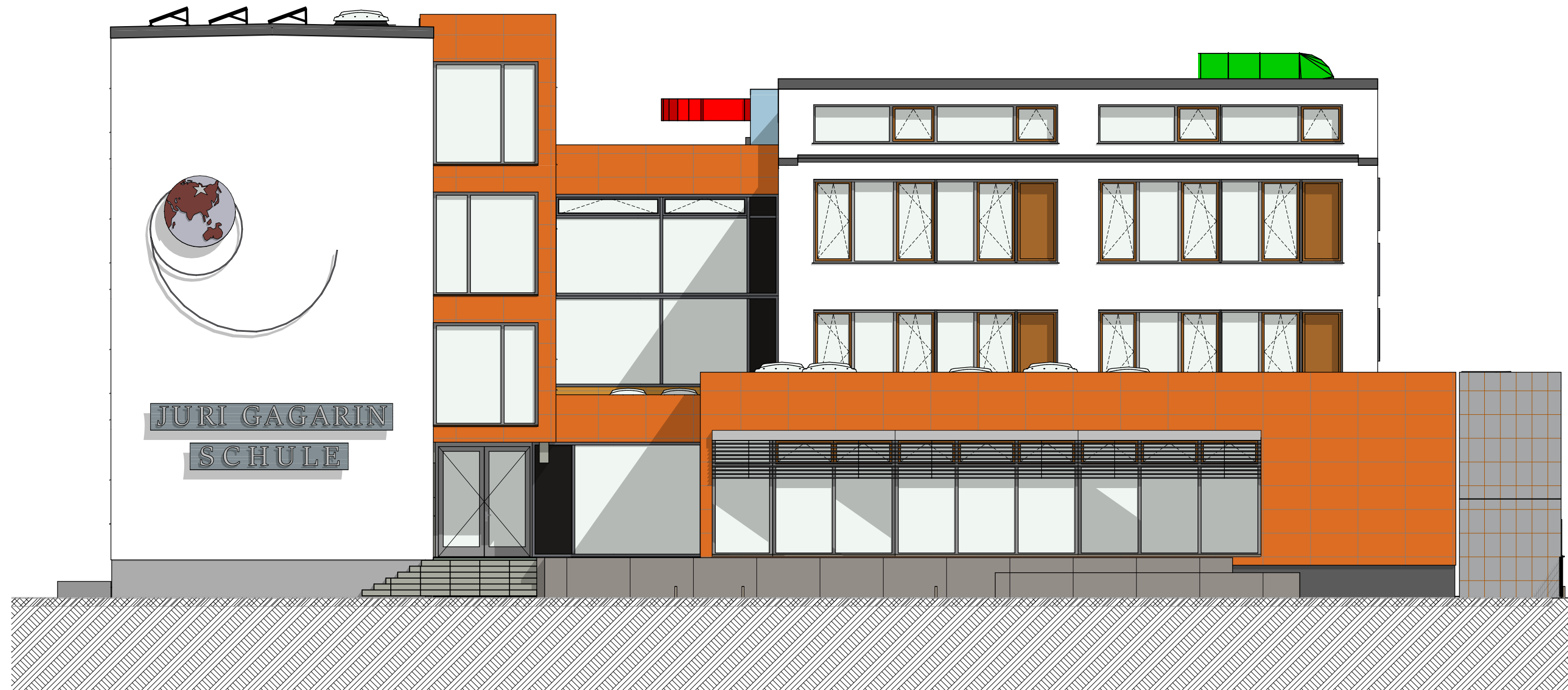
Ansicht von Osten